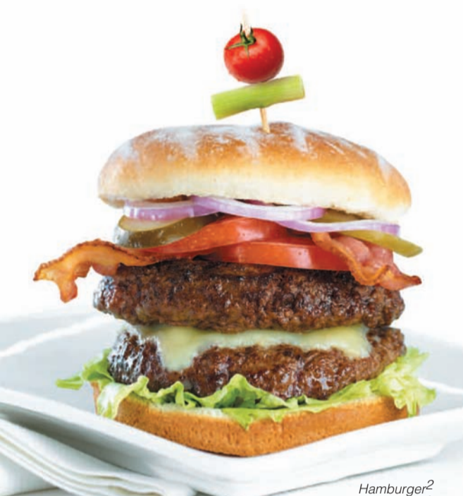
Hamburger 2 Burger 2

Remplacez par des frites de patate douce. 3,49 $ | Remplacez par une soupe aux poivrons rôtis. 2,99 $ | Remplacez par une soupe à l'oignon gratinée. 4,99 $ Substitute Sweet Potato Fries $3.49 | Substitute Roasted Red Pepper Soup $2.99 | Substitute French Onion Soup $4.99