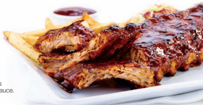
Fameuses côtes levées Casey's Casey's Famous Ribs

A quarter rotisserie chicken breast and a half rack of our mouth-watering slow-roasted back ribs. Comes with fries, slaw and hot chicken BBQ dipping sauce. Leg $24.99