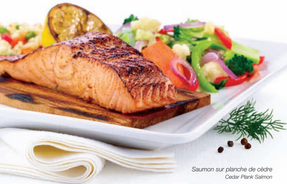
Saumon sur planche de cèdre Cedar Plank Salmon

Baby spinach, Mandarin oranges, red peppers, chopped egg and bacon tossed in orange poppy seed dressing and topped with a skewer of grilled shrimp, crisp onion strings and Feta cheese. $14.99 Lose the shrimp. $11.99