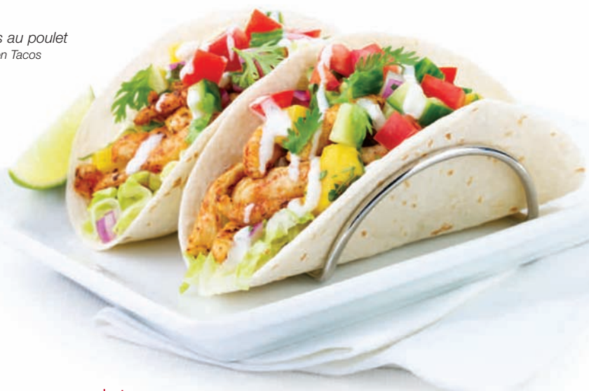
Tacos au poulet Chicken Tacos

Melted cheese, spinach and artichoke hearts, baked and served with warm tortilla chips and Naan bread wedges. $11.99