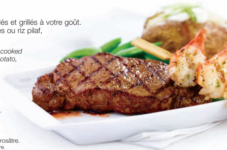
Contre-filet de 12 oz avec une brochette de crevettes grillées 12 oz. New York with a Grilled Shrimp Skewer

Bien cuit – Complètement cuit. Well Done – cooked throughout.