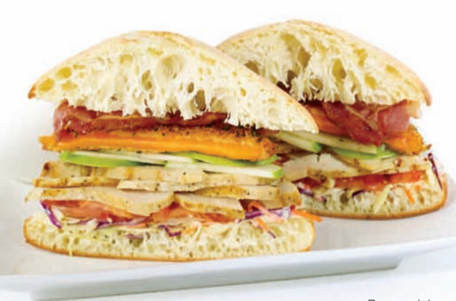
Du marché Stacked