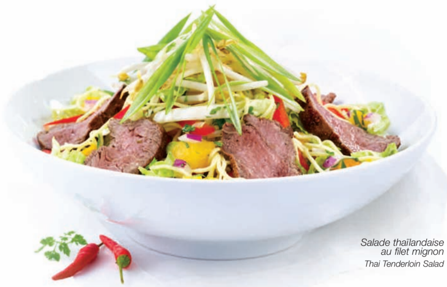
Salade thaïlandaise au filet mignon Thai Tenderloin Salad